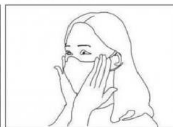
Premere leggermente per ottenere la migliore aderenza possibile anche sulle guance e sotto il mento

Rimuovere la mascherina evitando il contatto con la parte interna.