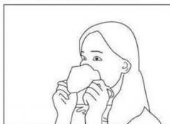
Indossare la mascherina appoggiandola prima sul naso