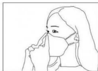
Agganciare gli elastici dietro alle orecchie. Conformare lo stringinaso facendolo aderire ai contorni